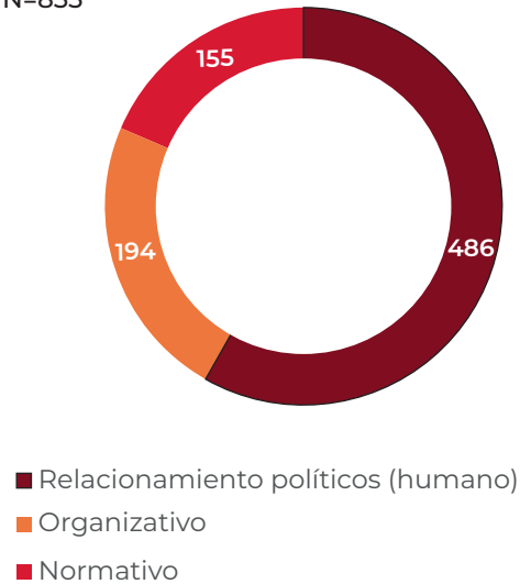
Gráfica 1 Factores de la conflictividad política 8 septiembre 2024 - 18 noviembre 2025 N=835

IUDPAS-REDNI-UNAH. (2025). Boletín Conflictividad y violencia política: elecciones, Honduras 2025 . Facultad de Ciencias Sociales.